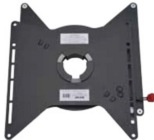
Modèle Mercedes Sprinter/VW Crafter