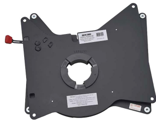
Modèle : Renault Traffic X82 / Opel Vivaro / Nissan NV 300 / Fiat Talento