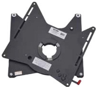
Modèle VWT5/VWT6 Pilote