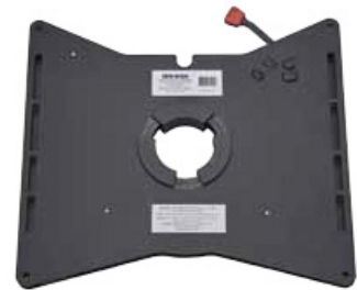
Modèle Ford Transit Custom